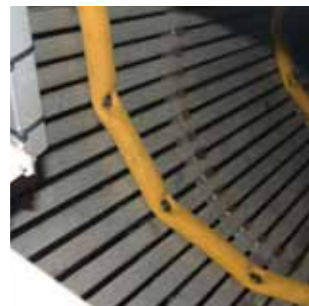
Trommel für Möhren mit Einlegeblechen